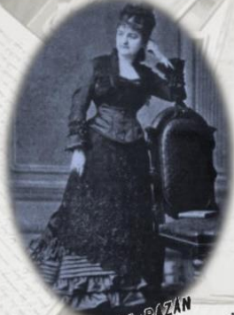
EMILIA PARDO BAZÁN

Era anoche la primera vez que una dama subía á la cátedra del Ateneo, la corporación más docta de todas las de Madrid, á leer un trabajo suyo original, en prosa, y no trabajo de imaginación como son de ordinario los de las no muy numerosas damas que entre nosotros cultivan la literatura, sino un estudio serio acerca de Rusia y su novela. El salón estaba completamente lleno de socios, no habia una localidad sin ocupar en la tribuna reservada de señoras, y el público se apiñaba á el está falta de sitio donde sentarse, en la que á el está destinada. A las nueve y media presentóse en la cátedra la ilustre escritora, del brazo del vicepresidente de la corporación, Sr. Azcozate, y su ligera inclinación de cabeza fué contestada con unánime salva de aplausos. La presencia de la señora Pardo Bazán predisponía en su favor. Llevaba anoche elegante vestido y era hercamente escotado, sin otro adorno que al-